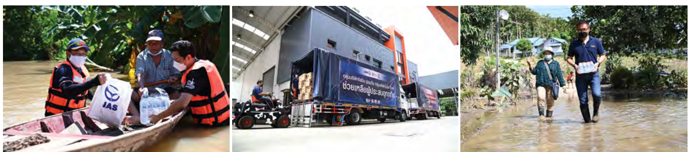
บริษัท จัสมิน อินเตอร์เนชั่นแนล จำกัด (มหาชน)

จากสถานการณ์อุทกภัยจากอิทธิพลพายุ “เตี้ยนหมู่” ในช่วงวันที่ 23 กันยายน – 7 ตุลาคม 2564 ที่ผ่านมา กลุ่มบริษัทจัสมินฯ ได้จัดทำโครงการ “กลุ่มบริษัทจัสมินฯ ช่วยเหลือผู้ประสบอุทกภัย” ด้วยการส่งมอบถุงยังชีพ ประกอบด้วยเครื่องอุปโภค บริโภค เวชภัณฑ์ต่างๆ ในการให้ความช่วยเหลือผู้ประสบอุทกภัยในจังหวัดสระบุรี อ่างทอง ลพบุรี สิงห์บุรี ชัยนาท นครสวรรค์ พระนครศรีอยุธยา ปัตตานี ยะลา และนราธิวาส นอกจากนี้ยังได้จัดทำโครงการ จัสมินฯ ร่วมใจ ช่วยเหลือฟื้นฟู ผู้ประสบอุทกภัย ในเขตอำเภอยิ้มผาง จังหวัดตาก อีกด้วย